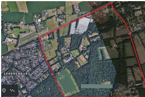
Figuur 1 begrenzing ontwikkelgebied Hooge Heide/ Sparrenburg/ Binckhorst

In deze beknopte visie beperken we ons tot het gebied Sparrenburg en Binckhorst: