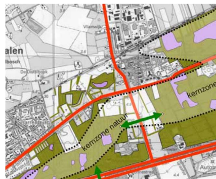
Figuur 3 Deel visie Hooge Heide Midden 2001