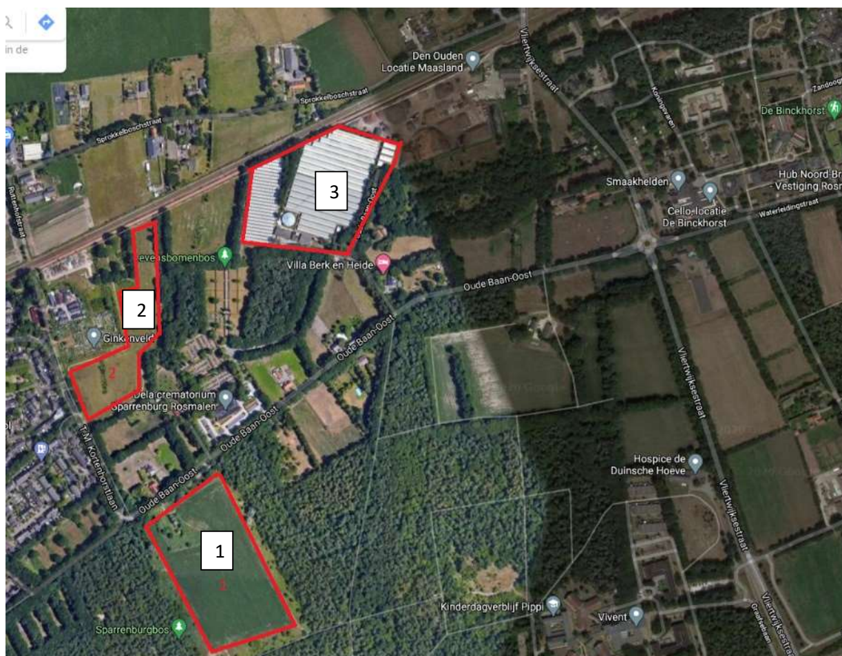
Figuur 5 Kansen voor energie

Met nummer 2 op onderstaande tekening is aangegeven de 'landjes van Korsten' ook wel aangeduid als het Sprokkelboschveld. Deze gronden hebben een agrarische bestemming en zijn in eigendom van de gemeente 's-Hertogenbosch. Op initiatief van de Tafel Groen Sparrenburg (toen nog opererend onder de naam: Commissie Groen) staat de gemeente met ingang van 2020 het uitrijden van mest op deze percelen niet meer toe. Deze gronden zouden gedeeltelijk omgevormd kunnen worden tot zonnepark, maar dan wel gekoppeld met een ecologische doelstelling, of volledig voor natuurontwikkeling ingezet kunnen worden.